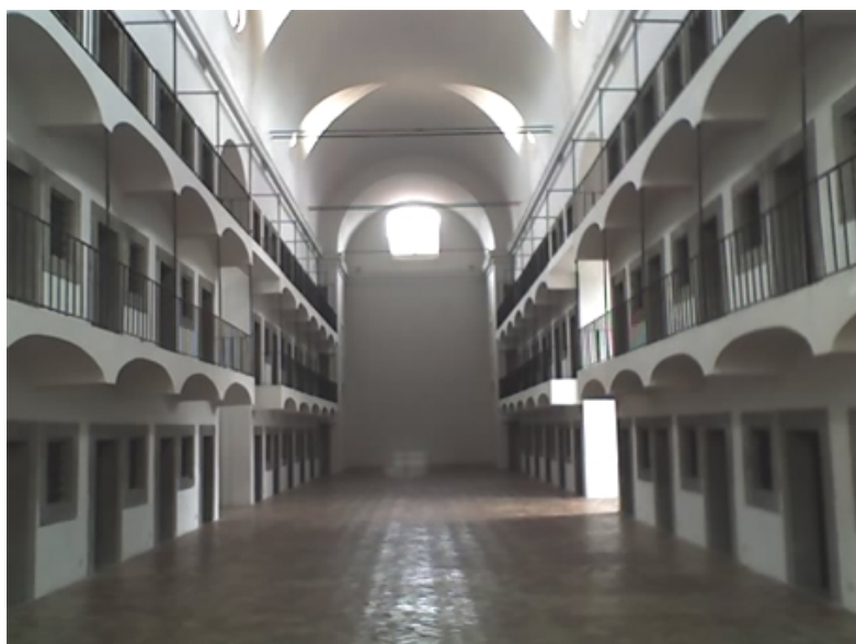
Roma, ex Carcere di Correzione del San Michele Luogo-paradigma di SADE : opus contra naturam

SADE : voyage en Italie non segue la logica di una normale distribuzione teatrale — quella da grand tour ministeriale, per intenderci — ma di quella passionale, biografica e libertina di Sade. Più che il voyage di un'opera è un'opera in forma di voyage . SADE : opus contra naturam non viene replicato, infatti, ma ricreato, attualizzato di volta in volta come una costante filosofico-orgiastica da reimmaginare, teatralmente, nei luoghi singolari in cui viene rappresentato e che della rappresentazione vengono a costituire, per la loro singolarità, varianti irripetibili. Ogni luogo dell'itinerario è una chiave di scrittura teatrale della rappresentazione che in esso si iscrive e la rappresentazione una chiave di lettura sadiana del luogo in cui essa si svolge. In termini di immaginario, le architetture sono per l'opera teatrale ciò che i luoghi e i climi sono per l'eroticismo di Juliette.